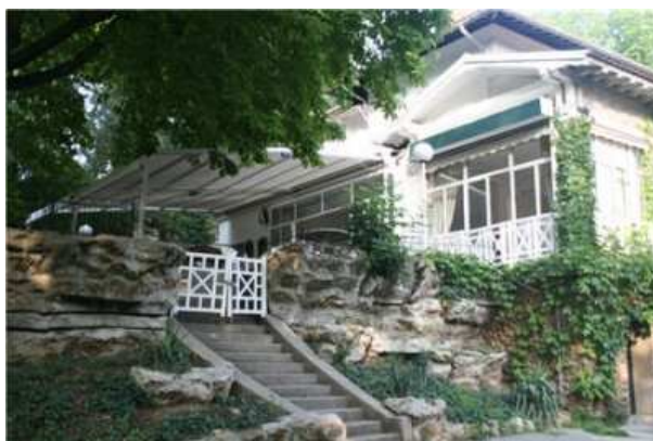
Le pavillon Puebla